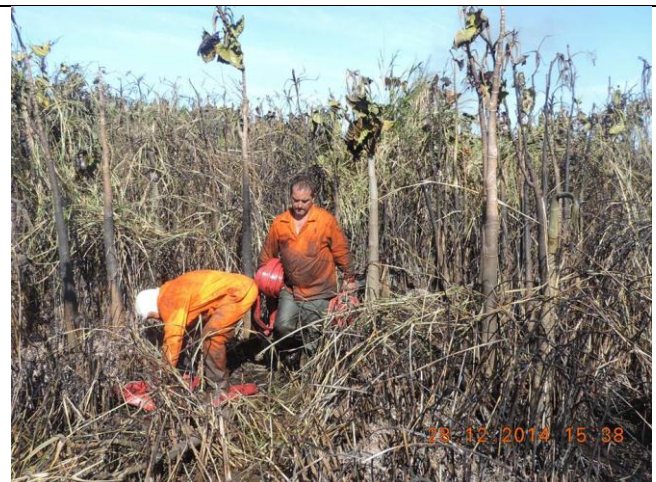
Imagens 02 e 03: 1º Combate próximo ao rio Angelim