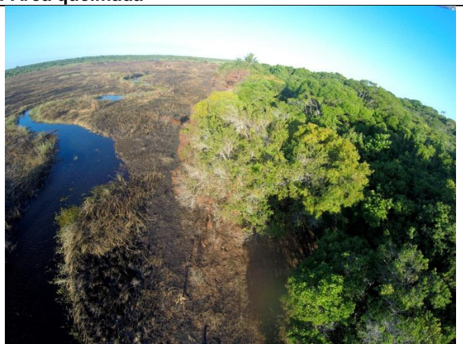
Imagens 06 e 07: Alagado + vista aérea da área queimada