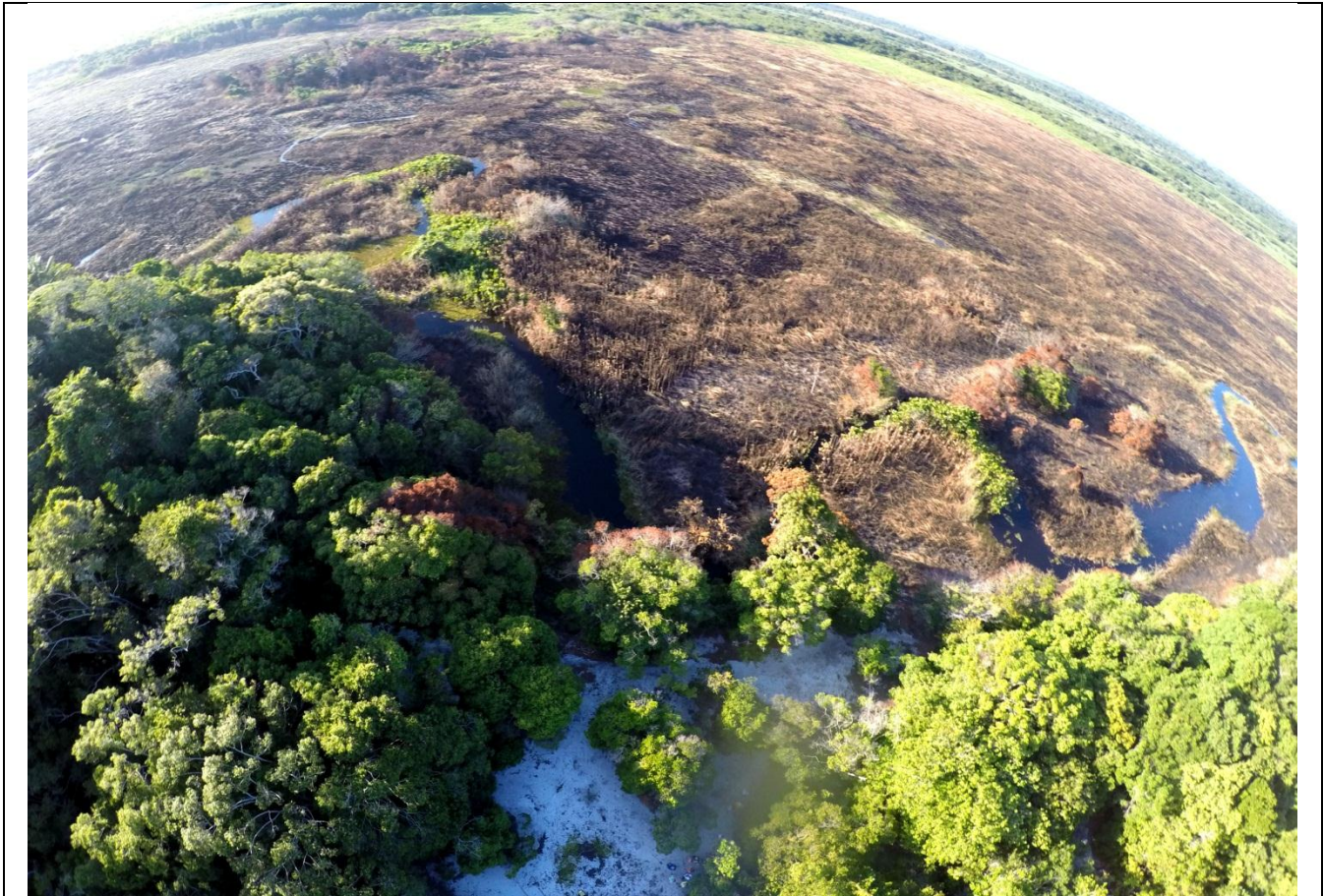
Imagem 01: Área aérea queimada