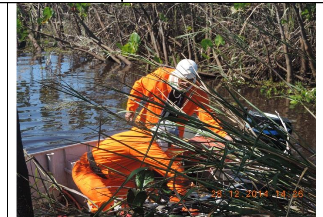
Utilização do Barco no Rio Angelim