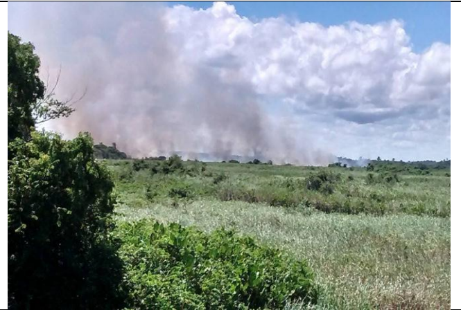
Imagens 04 e 05: Área queimada